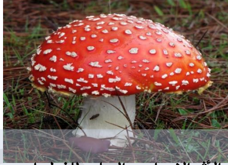
الأثر الايجابي و السلبي للفطريات