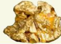
▲ مَعْدِنُ الذَّهَبِ

تُصَنِّعُ الْحُلِيِّ وَالْمُجَوَّهَرَاتُ مِنَ الذَّهَبِ.