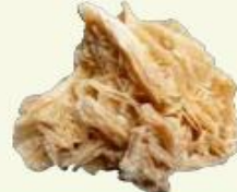
▲ مَعْدِنُ الْجِصِّ

تُصَنِّعُ دِيكُورَاتُ الْمَنَازِلِ مِنَ الْجِصِّ.