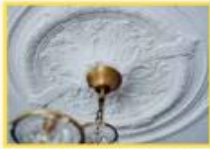
▲ دِيكُورَاتُ جِصِّ

تُصَنِّعُ دِيكُورَاتُ الْمَنَازِلِ مِنَ الْجِصِّ.