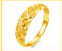
▲ خَاتَمٌ مِنَ الذَّهَبِ

أَسْتَتِجُ أَهْمِيَّةَ الْمَعَادِنِ فِي حَيَاةِ الْإِنْسَانِ.