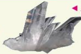
▲ مَعْدِنُ الْكُوارِثِ

تُصَنِّعُ زُجَاجَةُ السَّاعَةِ مِنَ الْكُوارِثِ.