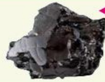
▲ مَعْدِنُ الْغَرَفِيتِ

يُصَنِّعُ قَلَمُ الرِّصَاصِ مِنَ الْغَرَفِيتِ.