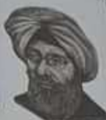
عبد الله بن عباس