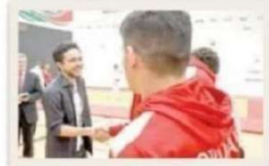
مبادرات مؤسسة ولي العهد.