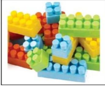
مادة صلبة قاسية لا يُمكن ثنيها

1. الحالة الصلبة : تكون جسيماتها متقاربة ومتراصة وهذا ما يُعطيها شكلاً مُحدداً . بعضها لين يُمكن ثنيها ، وبعضها قاس لا يُمكن ثنيها