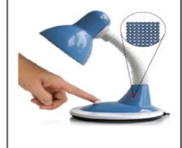
جسيمات المادة الصلبة متقاربة

2. الحالة السائلة : تكون جسيماتها متقاربة وغير متراصة وهذا ما يعطيها شكلاً غير محدد وحجماً ثابتاً .