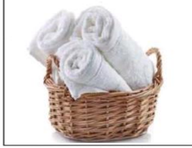
مادة صلبة لينة يُمكن ثنيها