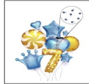
جسيمات المادة الغازية متباعدة