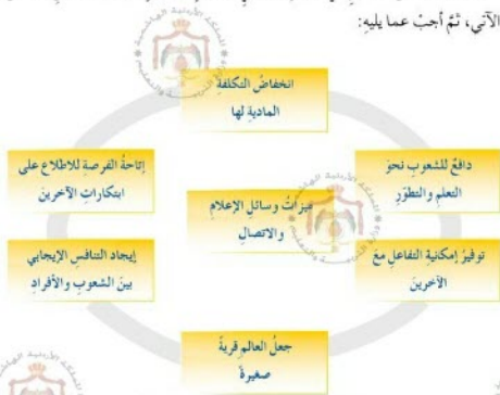
الشكل (٣-٥) ميزات وسائل الإعلام والاتصال

امتازت وسائل الإعلام في الوقت الحالي بميزات متنوعة، ولتعرفها تأمل الشكل الآتي، ثم أجب عما يليه: