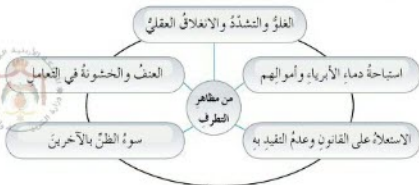
الشكل (٢-٧) من مظاهر التطرف

لتعرف مظاهر التطرف تأمل الشكل الآتي، ثم أجب عما يليه: