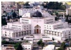
الشكل (١-٧): قصر العدل

يمثل المجلس القضائي الأردني قمة هرم السلطة القضائية في المملكة، وهو صاحب الصلاحيات القانونية في الإشراف الإداري على القضاة النظاميين في المملكة.