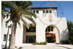
الشكل (١-٤): مبنى رئاسة الوزراء.

يطلق على السلطة التنفيذية اسم الحكومة، وهي الهيئة السياسية والإدارية العليا التي تشرف على أحوال الشعب وإدارة شؤونه وعلاقات أفرادها، وهي المسؤولة عن توفير وسائل الحماية والأمن للمواطنين.