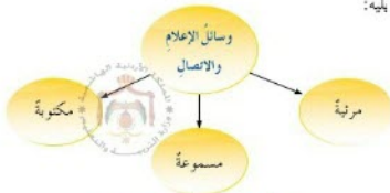
الشكل (٣-٣): وسائل الإعلام والاتصال.

تعددت وسائل الإعلام والاتصال وتنوعت منذ القدم. ادرس الشكل الآتي، ثم أجب عما يليه: