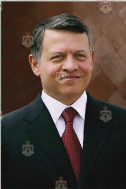
صاحب الجلالة الهاشمية الملك عبد الله الثاني ابن الحسين حفظه الله ورمعاه ملك المملكة الأردنية الهاشمية