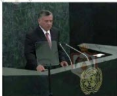
الشكل (٢-٦) جلالة الملك عبد الله الثاني ابن الحسين في الأمم المتحدة.

”حربنا العالمية اليوم ليست بين الشعوب أو المجتمعات أو الأديان، بل هي حرب تجمع كل المعتدلين من جميع الأديان والمعتقدات ضد كل المتطرفين من جميع الأديان والمعتقدات...”