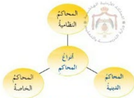
الشكل (٩-١): أنواع المحاكم.

وتنقسم المحاكم بحسب المادة (٩٩) من الدستور ثلاثة أنواع، تظهر في الشكل الآتي: