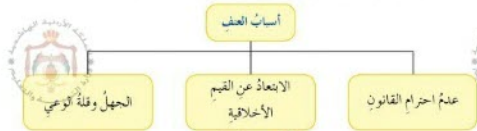
الشكل (٧-٢) أسباب العنف

لتعرّف أسباب العنف، تأمل الشكل الآتي، ثم أجب عما يليه: