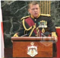
الشكل (١-١): جلالة الملك عبد الله الثاني في مجلس الأمة.